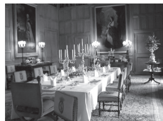
ダンロビン城の一室