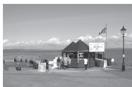
ジョン・オ・グローツ

隣町のウィックには最北端の蒸留所オールドプルトニー、工芸ガラス工場、またエジンバラ方面に行く飛行場があります。この飛行場は飛行機を誘導する管制がありません。離着陸は操縦士の腕一つ、霧や視界不良があれば飛行機は来ないのです。