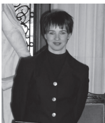
ダンロビン城の受付さん

テインは焼き物の工場があります。スコットランドの国花のアザミを描いた食器を中心に製造販売をしています。こちらの作業場は見学できます。