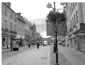
インヴァネス市街

インヴァネスは人口が6万人程で、ハイランドの中核都市です。名前のインヴァネスはネス川の河口という意味だそうです。交通の要衝になっていて、空港はロンドンをはじめ各都市の間で航空便が有ります。列車はスコットランドの各都市を結びロンドンへは昼夜各一本の直通列車が発着しています。街の中心にはマークス&スペンサーを中核にしたショッピングモールや商店街が有ってにぎわっています。サーソーに住んでいて、改まった買い物はこちらまで来られるようです。