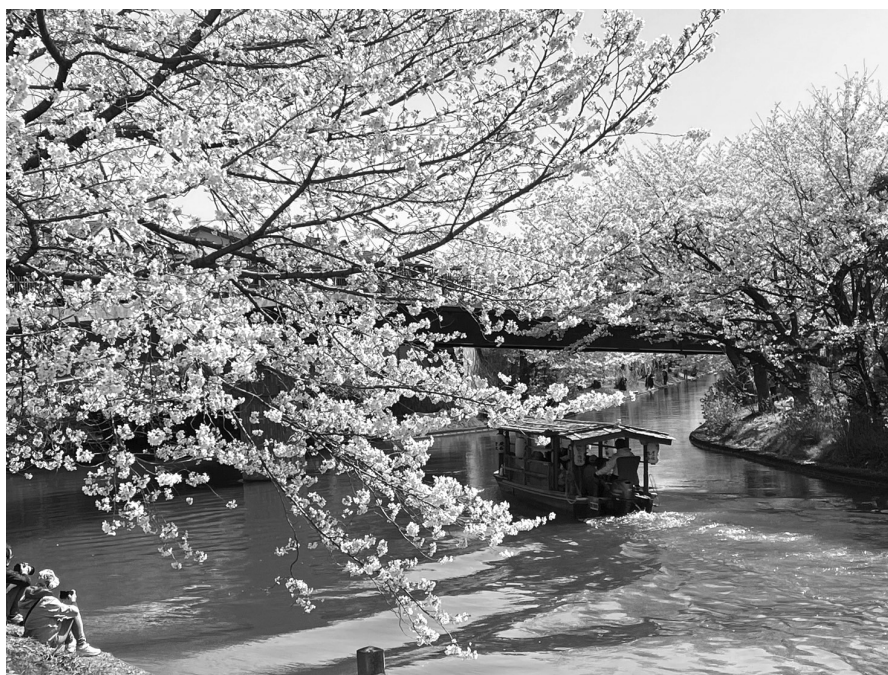
春のウォーキング 伏見：濠川・宇治川派流合流点