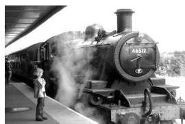
アピモアの保存鉄道

コーダ城はシェークスピアの戯曲「マクベス」の舞台になったお城だそうです。そう大きな城ではないですが、今も城主が住んでいるとの事。よく手入れされた庭がきれいでした。