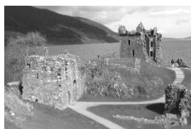
ネス湖とアーカート城

アピモアは国立公園にあるリゾート地です。夏休みは訪れる人が多くホテルやレストランが並んでいます。SLによる観光鉄道が運転されていて、家族客でにぎわっていました。