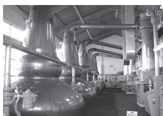
クライネリッシュ醸造所

ブローラにはクライネリッシュ醸造所があります。有料ですが工場内をじっくりと案内し、最後にシングルモルトを試飲させてくれます。