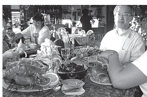
ヘルムスデールで魚介料理

ヘルムスデールには漁港があります。近海で採れた魚介類を食べさせてくれるレストランが有名で、カニ、エビ、貝、魚・新鮮なものがいただけます。