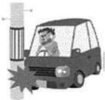
ドライブ中のケガ