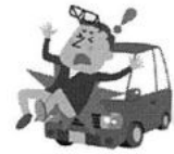
自動車にはねられて のケガ