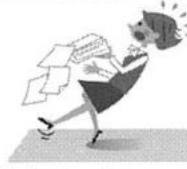
お仕事中、転んでのケガ