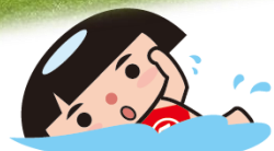
かながわキヌタロウ