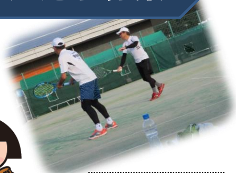
前回の和歌山大会の様子